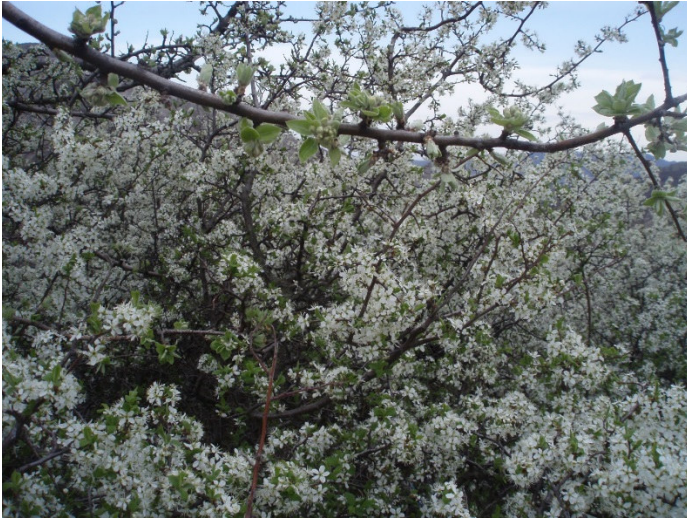
Цветенье крымской весны