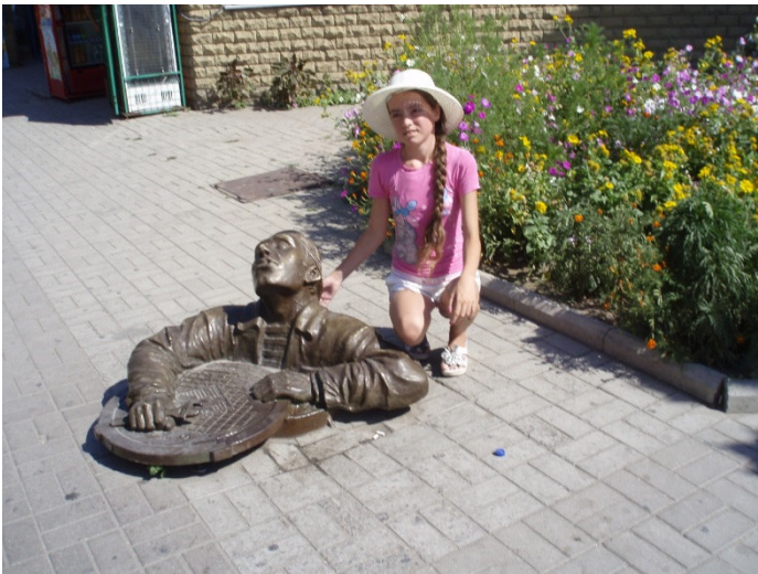
Автор в Бердянске