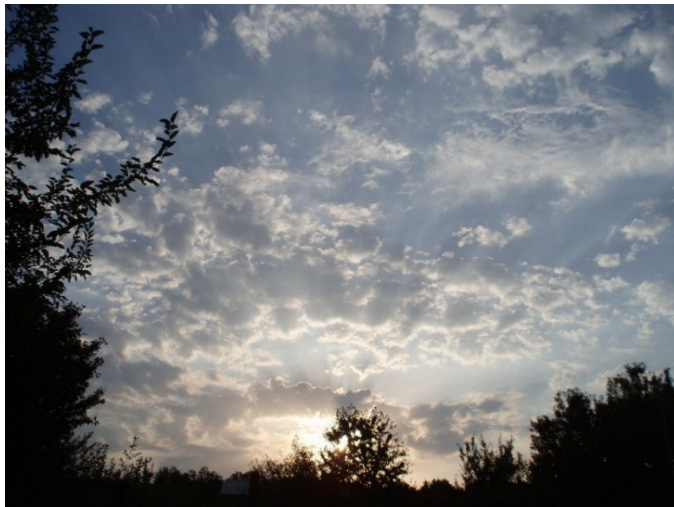
Порталом неба начинаю день... «Поэтический портал»