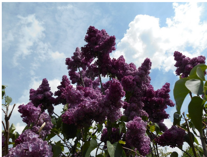
Ах, сирень, гроздь нежные... «Лепестки счастья»