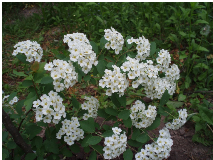
Цветов пестреющий узор... «Украина»