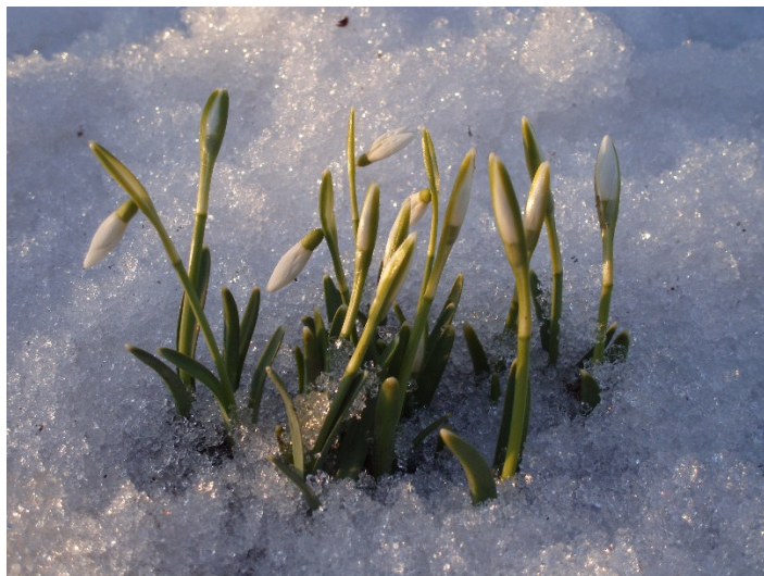
Лунное озеро горных подснежников Крыма. «Подснежник любви»